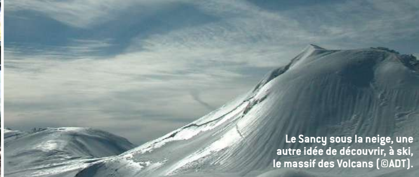
Le Sancy sous la neige, une autre idée de découvrir, à ski, le massif des Volcans.