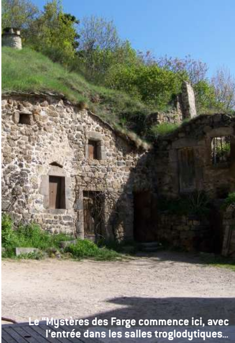
Le "Mystères des Farges" commence ici, avec l'entrée dans les salles troglodytiques...