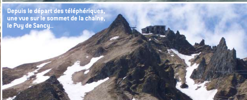
Depuis le départ des téléphériques, une vue sur le sommet de la chaîne, le Puy de Sancy...

Il faut se rappeler qu'à l'époque, l'électricité était encore rare et pour faire fonctionner l'installation il a fallu créer une retenue d'eau sur la Dordogne toute proche. Une usine hydroélectrique est alors née pour fournir l'énergie en courant continu de 3 400 volts ! À mi-pente, on croise la même voiture qui descend et fait contrepoids. Installé en 1898, ce fut le premier funiculaire de France. Il a connu, évidemment, quelques retouches sécuritaires et achemine sans peine ses quarante occupants à la station sommitale d'où des circuits pédestres permettent des promenades qui vous pousseront, peut-être, jusqu'au restaurant typique et, pour les plus courageux, jusqu'au sommet du Capucin à 1 485 m.