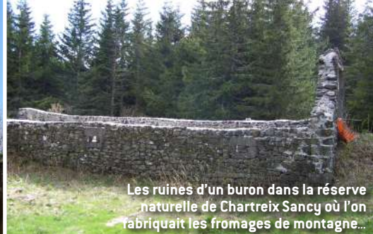
Les ruines d'un buron dans la réserve naturelle de Chartreix Sancy où l'on fabriquait les fromages de montagne...