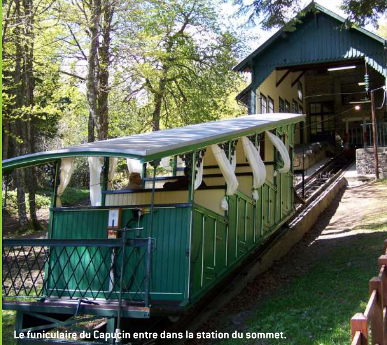
Le funiculaire du Capucin entre dans la station du sommet.