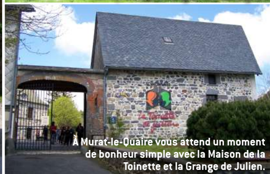
À Murat-le-Quaire vous attend un moment de bonheur simple avec la Maison de la Toinette et la Grange de Julien.